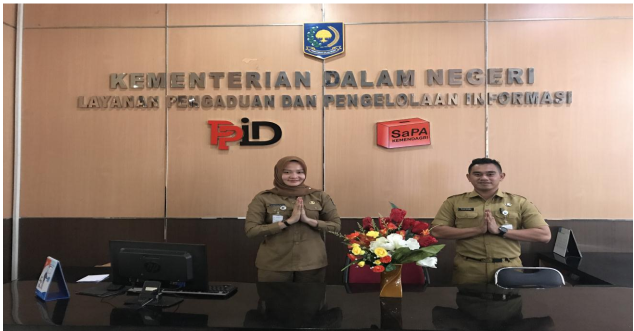
(meja layanan Informasi Publik)

Dalam rangka mendukung terlaksananya pelayanan pengelolaan Informasi Publik di lingkungan Kementerian Dalam Negeri, PPID Kemendagri menyiapkan sejumlah fasilitas yang digunakan untuk melayani permohonan Informasi Publik.