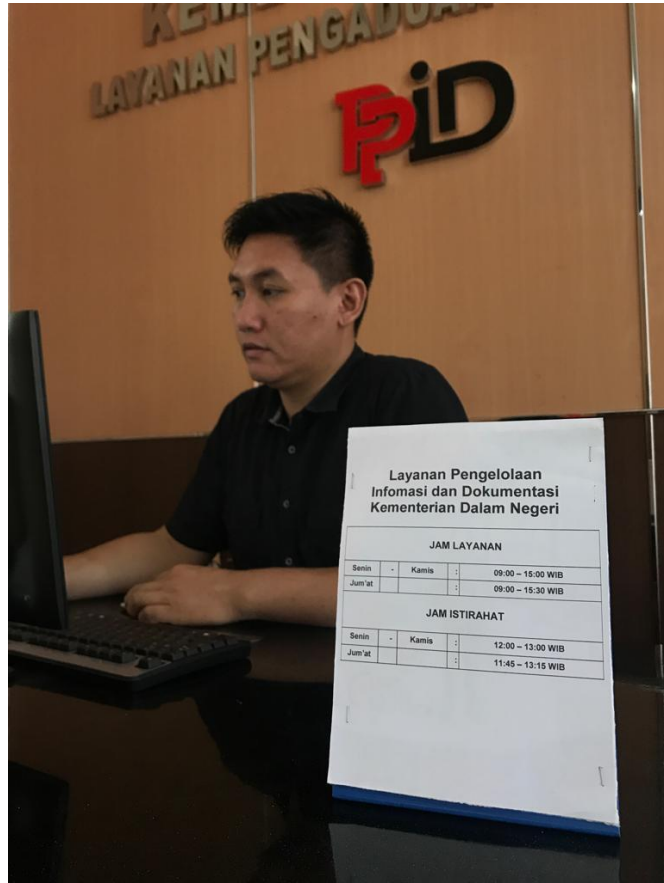
(Jadwal Pelayanan Informasi Publik)