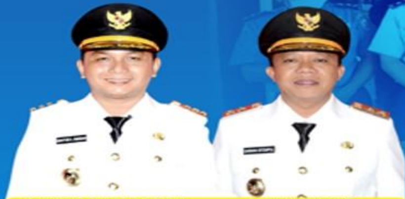
BAKHTIAR AHMAD SIBARANI BUPATI TAPANULI TENGAH

UPDATE DATA PASIEN PADA TANGGAL 21 JUNI 2020