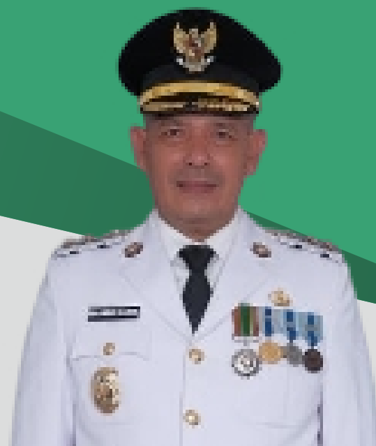
MAHMUD EFENDI LUBIS WAKIL BUPATI